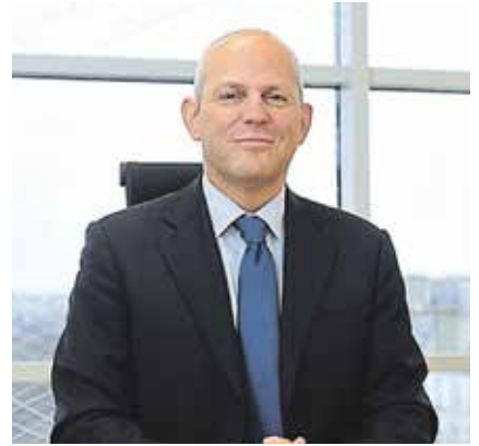
Pr. Jérôme SALOMON Directeur général de la santé

Le présent guide permettra de mieux formaliser la pratique du retour d'expérience. Il conviendra de faire preuve de flexibilité en adaptant les outils et la méthodologie mis à disposition, en prenant également en compte la diversité des situations rencontrées et les ressources nécessaires à sa mise en œuvre.